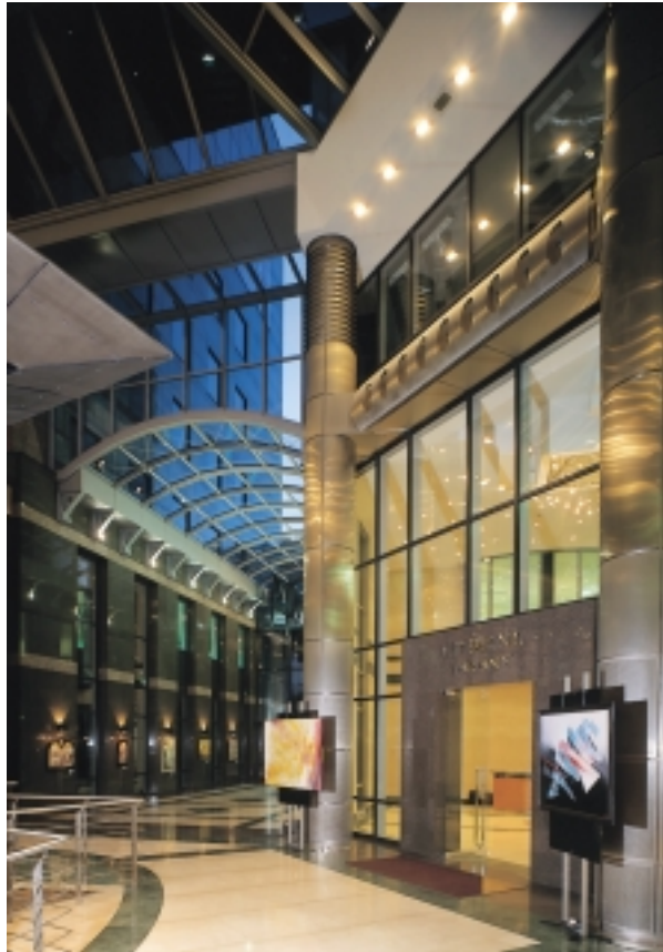
Citibank Tower, Bank Center, Budapest