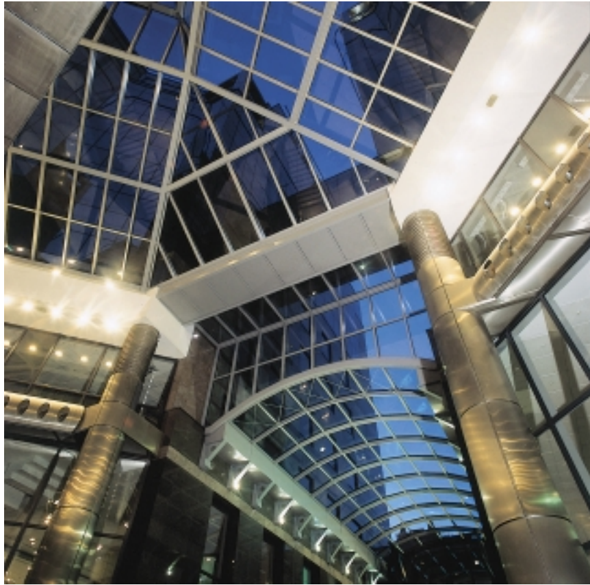
Citibank Tower, Bank Center, Budapest